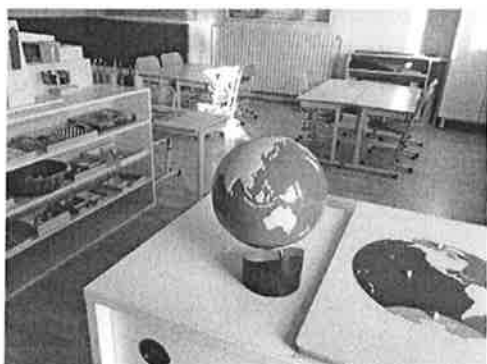
Une classe de l'école de Céré-la-Ronde (Indre-et-Loire). FP

D'où l'idée de prendre les devants. L'élus est alors entré en contact avec Sylvie d'Esclaibes, une pionnière de l'éducation Montessori en France, et fondatrice d'un cycle de formation allant de la maternelle au baccalauréat à Bailly (Yvelines). Celle-ci a déjà contribué à l'installation en milieu rural de plusieurs classes imprégnées de la pédagogie Montessori, notamment à Montherlant (Oise), un hameau de 150 habitants, dépourvu d'école depuis longtemps.